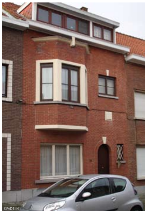
Rue Hoogeleeft, 25 -1120 Bruxelles Horaire des visites : de 10 h 00 à 13 h 00 et de 14h 00 à 18h 00.

Economies réalisées : 15% sur le gaz, 86% sur l'eau. L'installation solaire couvre 50% des besoins en eau chaude sanitaire.