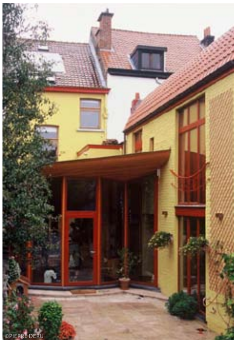
Rue Jan Bollen, 36 - 1020 Bruxelles Horaire des visites : de 10 h 00 à 13 h 00 et de 14h 00 à 18h 00