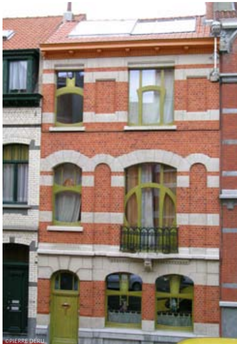
Rue Louis Hap, 216 - 1040 Bruxelles Horaire des visites : de 10 h 00 à 13 h 00 et de 14h 00 à 18h 00

Economies réalisées : non évaluées. L'installation solaire couvre 50% des besoins en eau chaude sanitaire.