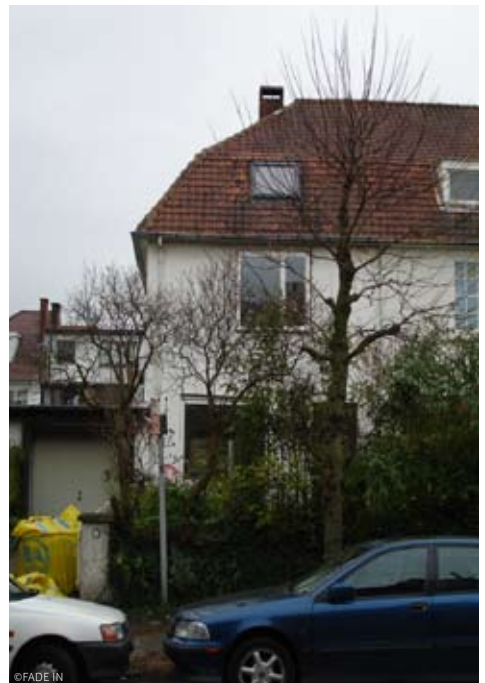
Rue du Ham, 62 - 1180 Bruxelles Horaire des visites : de 10 h 00 à 13 h 00 et de 14h 00 à 18h 00

Economies réalisées : non évaluées, chantier en cours.