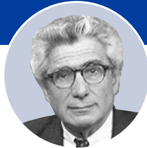
Pr Patrice Boyer European Brain Council, Belgique